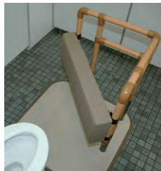
便器からの移乗に…

※ 利用者の身体状況により、介助手順が異なる場合があります。十分モニタリング・フィッティングを行なった上で使用してください。