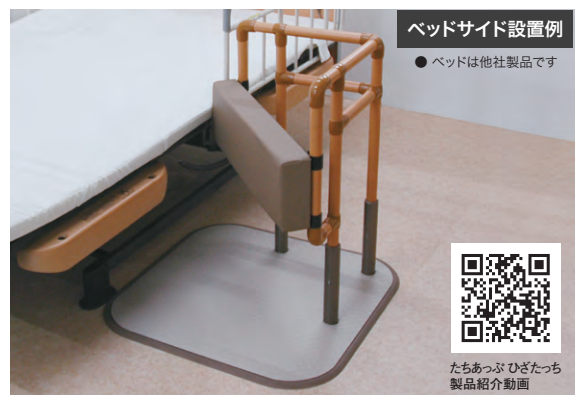
ベッドサイド設置例 ● ベッドは他社製品です