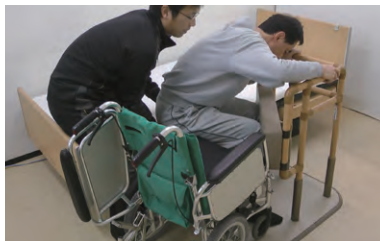
ベッドからの移乗に…

※ 利用者の身体状況により、介助手順が異なる場合があります。十分モニタリング・フィッティングを行なった上で使用してください。